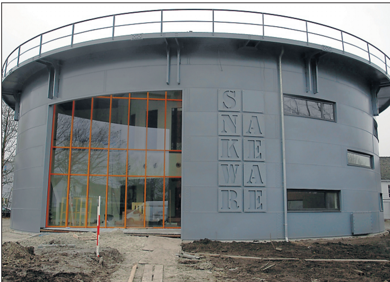
De tot duurzaam kantoor omgebouwde gashouder op het veemarkterrein in Sneek.

Medewerkers van Otte Installatie zijn nog druk in de weer met onder andere de gecentraliseerde voorzieningen voor de klimaatbeheersing in de onder andere met speciale ramen optimaal geïsoleerde gashouder die nu twee ringvormige verdiepingen telt. Opvallend: waar vroeger aan de rand van het veemarkterrein het gas borrelde, ont-