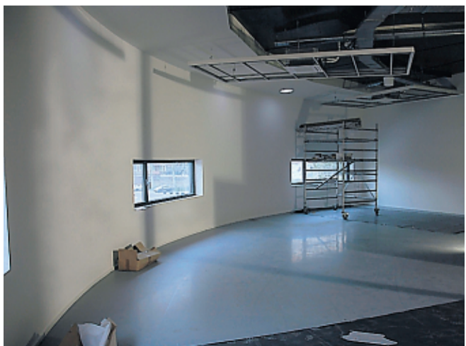
Een van de twee grote werkunits