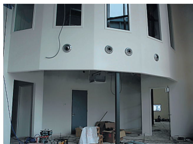
De plaats waar de welkomstbalie wordt ingericht